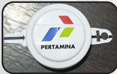
Contoh tampak luar Capseal 3/4"