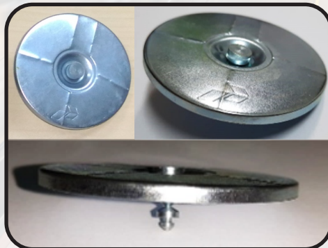
Contoh Incap 2"