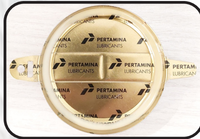
Contoh tampak dalam Capseal 2"