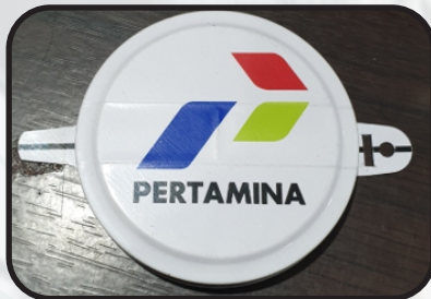
Contoh tampak luar Capseal 2"